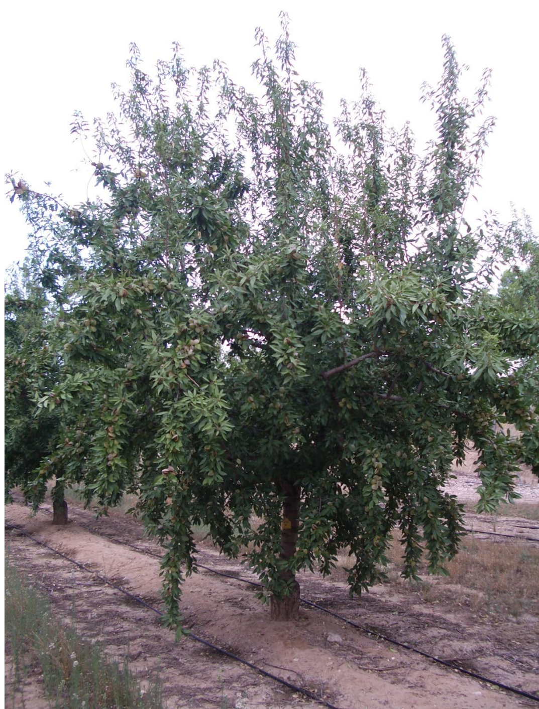
Fig. 3. Árbol de ‘Vialfas’ en producción

El árbol es de porte ligeramente erecto, aunque el peso de la producción inclina las ramas (Fig. 3). Las hojas muestran una gran tolerancia a las enfermedades fúngicas. Su productividad en los ensayos del CITA, así como en las parcelas experimentales de Caspe y de Aniñón es muy elevada.