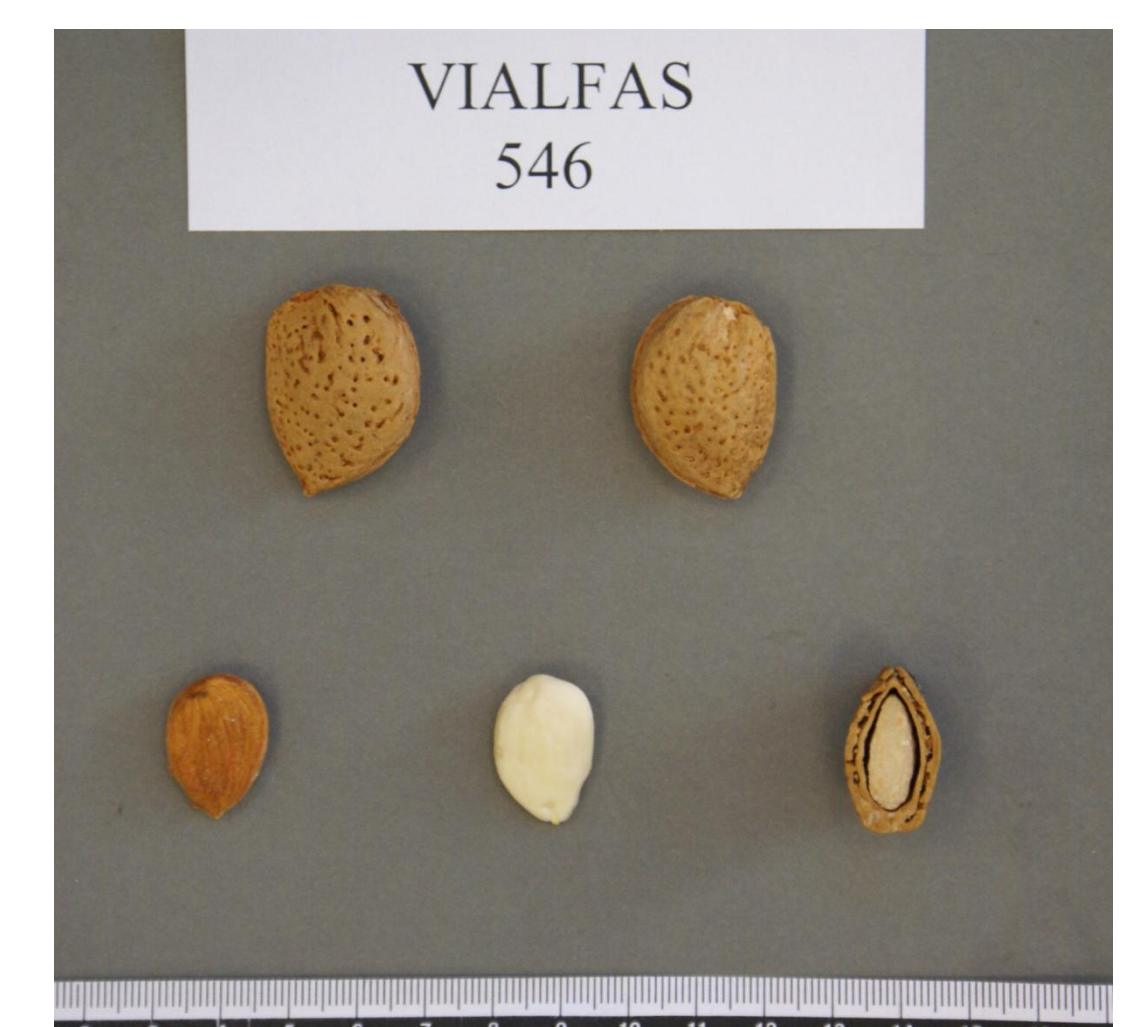
Fig. 2. Frutos y pepitas de ‘Vialfas’